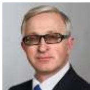
Александр ШОХИН, президент Российского союза промышленников и предпринимателей

Появление в России столь статусной выставки-форума по текстильной и легкой промышленности свидетельствует о том, что отечественный и иностранный бизнес, институты развития предпринимательства и власти спустя долгие годы «недомолвок» наконец-то смогли прийти к общему знаменателю. И действительно, по существу, объединились четыре ведущих текстильных выставки страны – это, без преувеличения, мечта многих лет. Все стороны этого торгово-экономического процесса активно участвуют в возрождения текстильной отрасли России и данная тенденция к объединению усилий сохранится