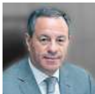
Александр Браверман, Генеральный директор Федеральной корпорации МСП